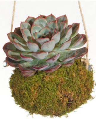
Echeveria hauteur 20cm - 18€