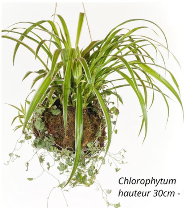
Chlorophytum hauteur 30cm - 18€