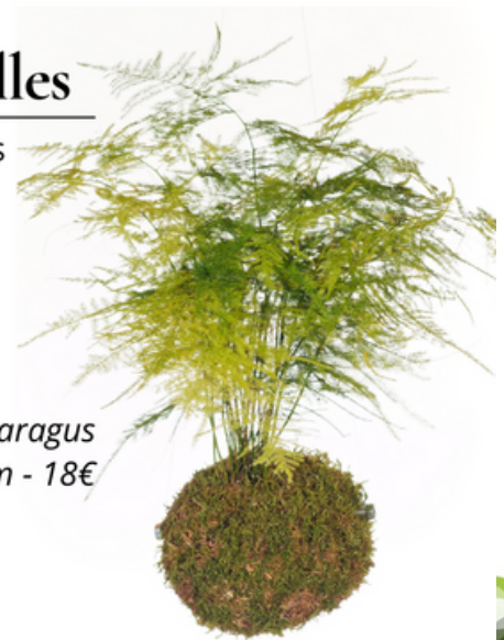
Asparagus hauteur 40cm - 18€