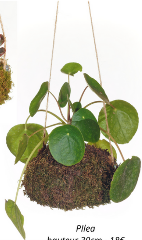
Pilea hauteur 30cm - 18€