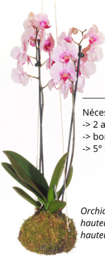
Orchidée hauteur 20cm - 18€ hauteur 30cm - 35€